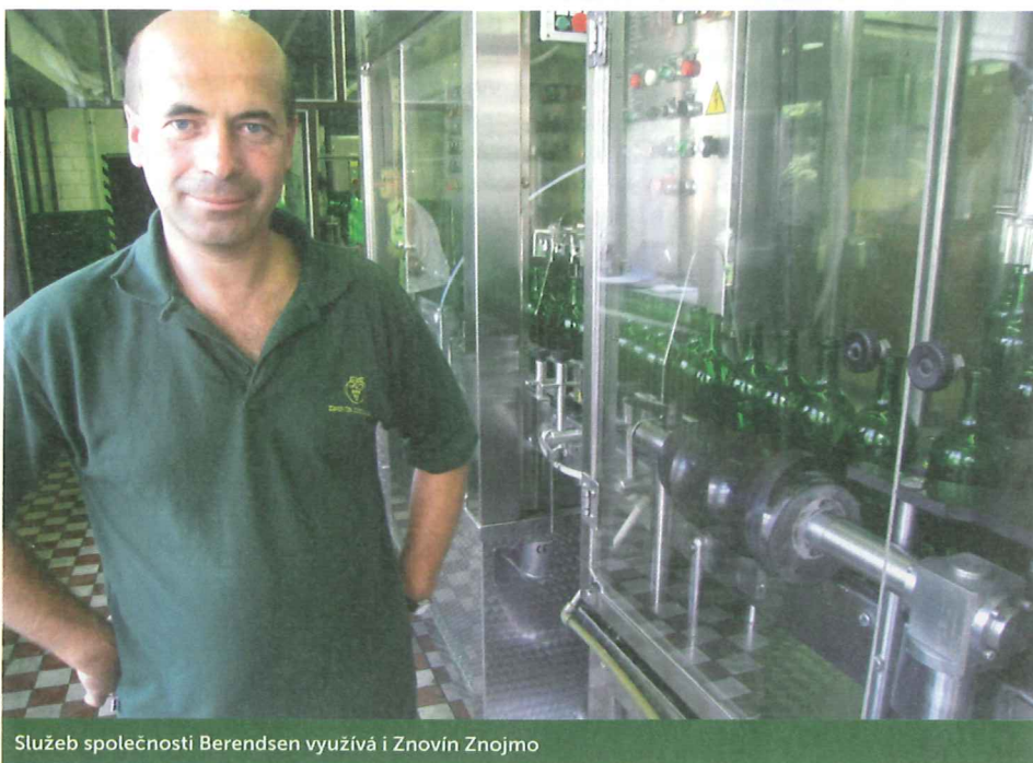
Služeb společnosti Berendsen využívá i Znovín Znojmo